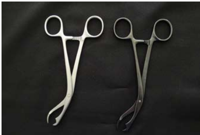
Chirurgisches Instrument | links nach der Aufbereitung durch HENKEL | rechts mit Belagsbildung | Material: 1.4116 / 420MoV