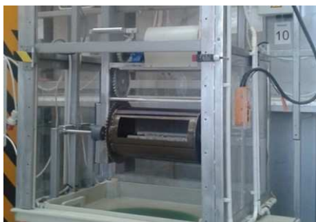
HENKEL Dob-Elektropolírozó berendezés